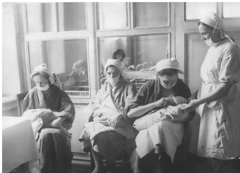
Рис. 2. Пациентки роддома в Молотове Fig. 2. Patients of the maternity home in Molotov