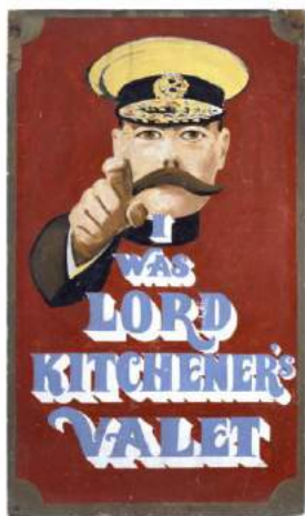
Илл. 2 Вывеска магазина «I was Lord Kitchener's Valet»

Магазин «I was Lord Kitchener's Valet» в 1960-е гг. использовал для рекламы образ Китченера, указывающего пальцем на смотрящего (на данный момент вывеска находится в музее Виктории и Альберта) (илл.2).