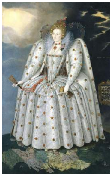
Илл. 3. Маркус Гераэрт Младший «Портрет Дитчли», 1592

вые» («raddled») и «покрашенные хной» («hennaed»). Цвет волос королевы является знаковым компонентом ее образа.