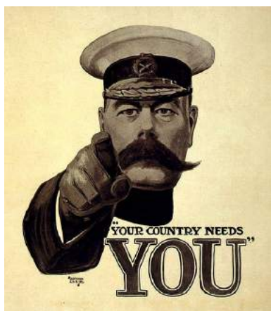
Илл. 1. Плакат с изображением Герберта Китченера

горна, а бряцаньем и воем электрической гитары, подключенной к усилителю» [Byatt 1994: 7–8]. Название магазина соответствует широко известному в 1960-е гг. магазину одежды, продававшему старинную униформу и располагающемуся в районе Ноттинг Хилл в Лондоне. Магазин «Я служил камердинером Лорда Китченера» назван в честь известного британского военного деятеля Герберта Китченера (1850–1916), занимавшего пост военного министра Великобритании во время Первой мировой войны. Его образ известен по изображению на плакатах во время Первой мировой войны, на которых он указывает пальцем на смотрящего. Плакат сопровождается слова «Твоя страна нуждается в тебе» (илл.1).