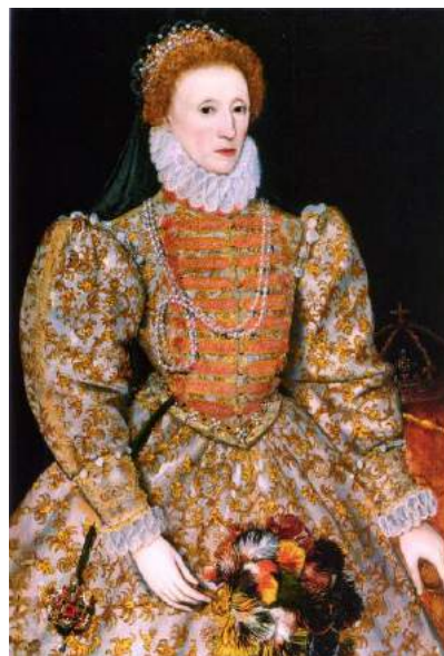
Илл. 4. Неизвестный художник «Портрет Дарнли», 1575

Дойдя, наконец, до нужного зала, где собралась вся английская элита, Александр подходит к долгожданному портрету, «его любимому» [ibid.: 12] (илл. 4).